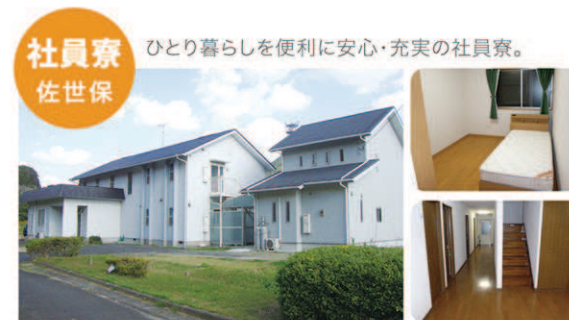
社員寮 佐世保 ひとり暮らしを便利に安心・充実の社員寮。